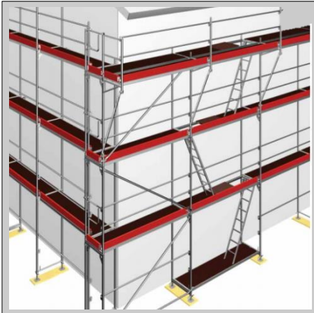
Andamio de fachada