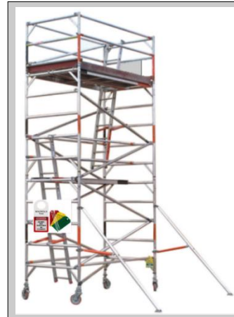
Andamio de torre móvil (con escalera interior)

EL CONTRATISTA , debe cumplir las siguientes normativas: