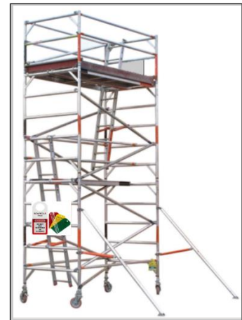
Andamio de torre móvil (con escalera interior)

EL CONTRATISTA , debe cumplir las siguientes normativas: