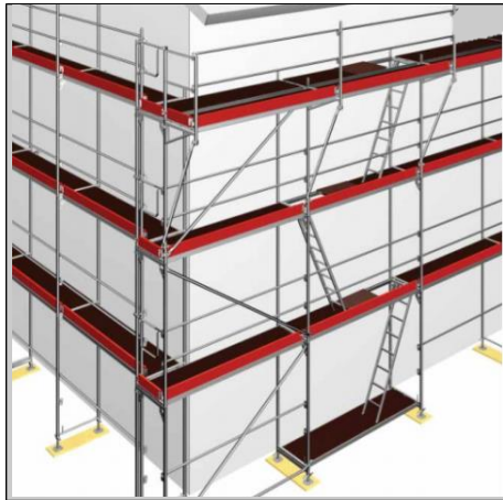
Andamio de fachada

Ejemplos de andamios de superficie de trabajo completamente protegida: