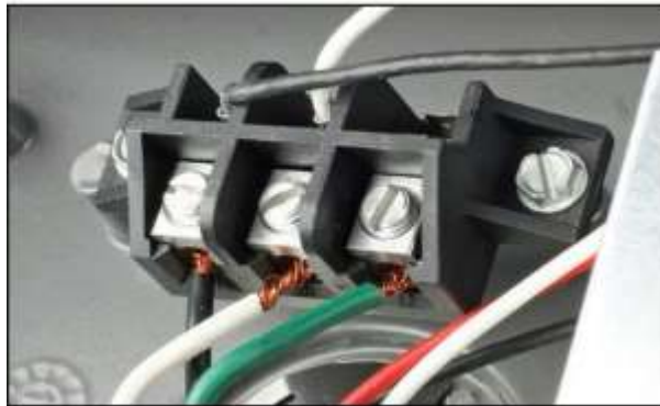
Ejemplo de bornera que cumple con requisitos de ENSA.

En la siguiente imagen se muestra un modelo de bornera que cumple los requisitos exigidos por ENSA. El fabricante debe tomar este modelo como referencia de exigencia mínima para presentar su propuesta.